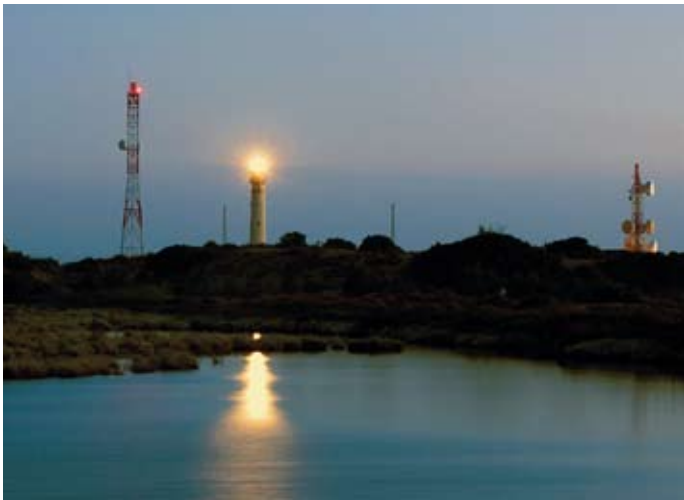
“Ojo y oídos”, de José Antonio Jerez Marín.