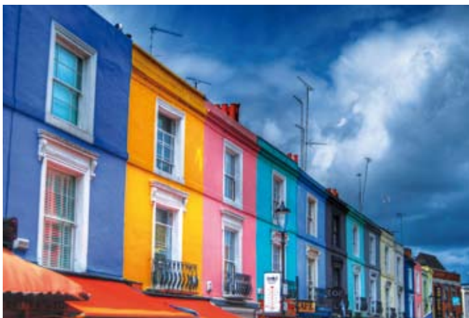
“Antenas en Portobello”, de Alejandro Veazco Cardaba.