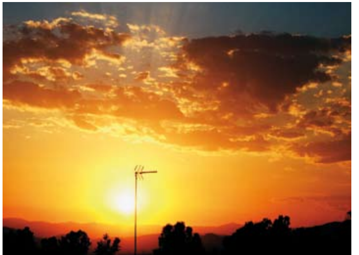
“Sola”, de Francisco Vázquez Cano