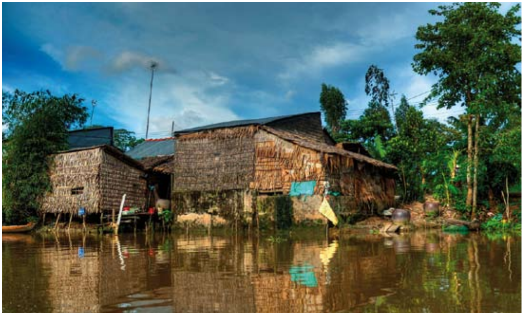
“La señal arriba a tot arreu”, de Jaume Mercade Barbani. Segundo premio.