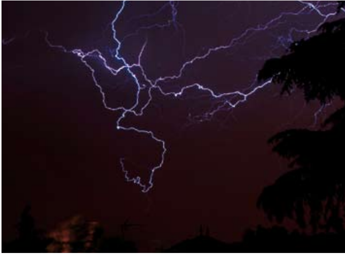
“Aparato eléctrico”, Enrique García Ayala.