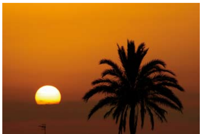
“Despidiendo al Sol”, de Lorenzo Soler Blanco.