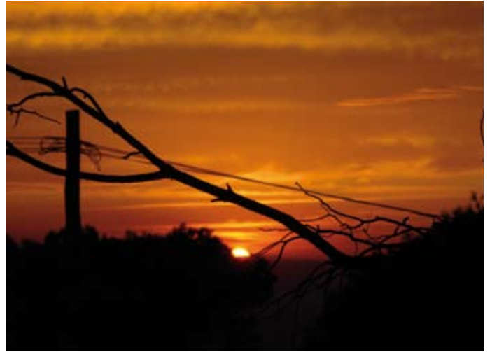
“La ventana indiscreta”, de Luis del Río Valtierra.