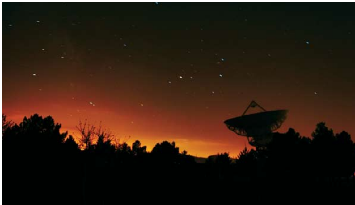
“Contact”, de Alberto José Vidal Borreguero. Primer premio.

Como todos los años, hemos vuelto a recibir una gran cantidad de fotografías, todas de alta calidad, por lo que ha resultado francamente difícil elegir las que consideramos mejores. Pero la dificultad se compensa por la alta participación. Y dada la gran acogida que ha tenido esta convocatoria, hemos decidido poner en marcha el VIII Concurso de Fotografía del COITT. Ya tenéis a vuestra disposición la página Web del Colegio para exhibir vuestros trabajos en formato digital, dos por concursante. Y como