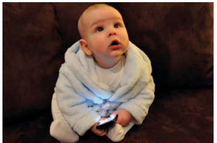
“Oiga usted, ¿esto cómo se usa?”, de Diego Balaguer-